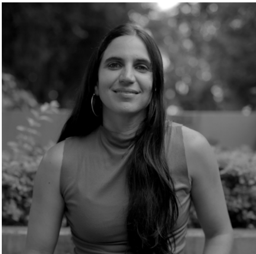
Anaïs Taracena, cineasta guatemalteca