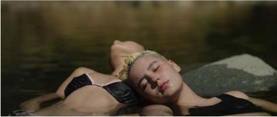
Fotograma de la película La Piel del Agua

ejemplo, montamos un concierto “real” del grupo Dylan Thomas, convocamos a los fans de la banda, pero decidí no parar el concierto, ni hacer tomas dirigiendo las acciones, sino nada más registrando lo que pasara. Eso lo hice durante varias escenas de la película y el resultado me encanta, es casi como espiar a alguien, no existe la consciencia de la cámara que genera algo artificial.