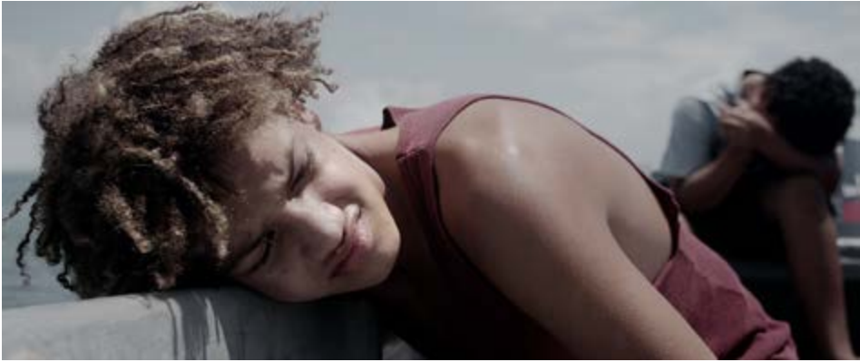
Fotograma de la película Dos aguas

conozco bastante bien, pues viví allí un año. Quería hacer una película que retratara a la gente del Caribe, gente trabajadora, pero que vive en condiciones muy limitadas. Mucha gente que está retratada allí es gente a la que conocí, a quienes les tengo cariño y a quienes les ha costado salir adelante. Por otra parte para mí es de los lugares más bellos que tiene el país, y es un lugar muy especial, donde no importan el color de la piel o la nacionalidad. Hay una contradicción muy grande en un lugar como éste, donde todo es exuberante y hermoso, pero a la vez difícil y sin muchas posibilidades de educación ni de empleo. El turismo genera posibilidades en la zona pero también dinámicas complicadas como consumo de drogas